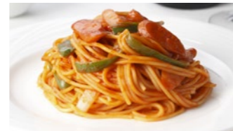
スパゲティ ナポリタン 1,458円