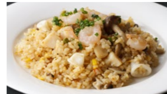
海の幸のピラフ 1,555円