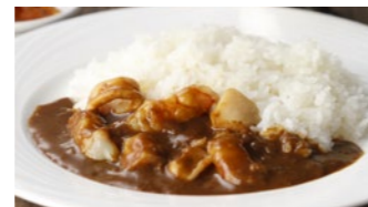
シーフードカレー 1,555円