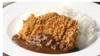
宮崎産南の島豚カツカレー 1,750円