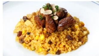
フィレビーフドライカレー 1,750円