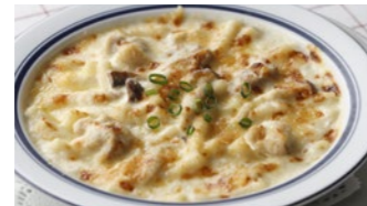
チキンと木の子のマカロニグラタン/ドリア 1,555円