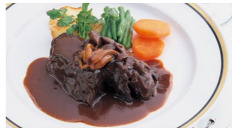
ビーフシチュー (ライス または パン付) 3,110円