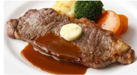
牛サーロインステーキ(和風 または デミグラス) 3,305円