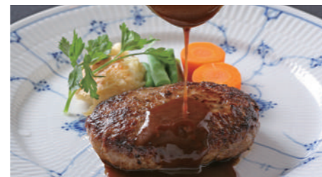
ハンバーグステーキ デミグラス 1,830円