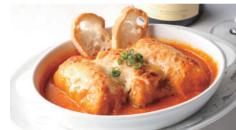
ロールキャベツ満天星風(トマトソース) 1,830円