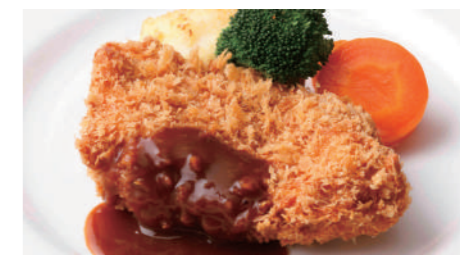
宮崎産南の島豚カツレツ(ロース) 2,160円