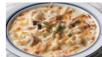
チキンと木の子のマカロニグラタン/ドリア 1,730円