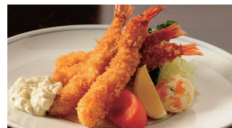
海老フライ タルタルソース 1,940円