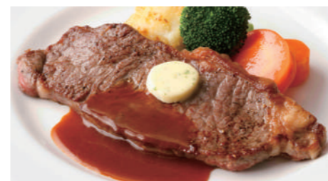
牛サーロインステーキ(和風 または デミグラス) 3,670円