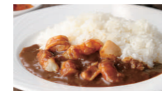
シーフードカレー 1,730円