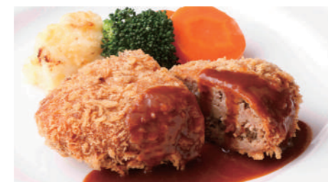
メンチカツ デミグラス 1,830円