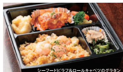
下記より好きな洋食メニューを2種類お選びいただけます。 ■オムレツライス ドミグラス ■ロールキャベツグラタン(トマトソース) ■チキンカレー ■海老フライ タルタルソース ■シーフードピラフ ■蟹クリームコロッケ ■ハヤシライス ■メンチカツ ドミグラス ■ドライカレー ■ハンバーグステーキ ドミグラス