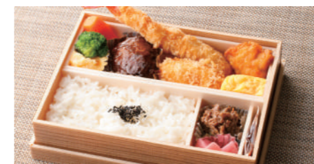
洋食弁当 1,720円 ハンバーグ・海老フライ・蟹クリームコロッケ・唐揚・一品・玉子焼・香の物・付合・白飯