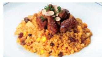
フィレビーフドライカレー 1,940円