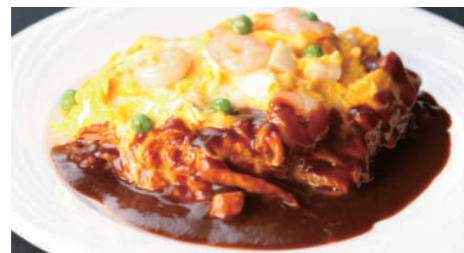
オムレツライス デミグラス 1,730円 (5~9月は衛生の観点より提供中止とさせていただきます。)