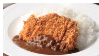
宮崎産南の島豚カツカレー 2,050円