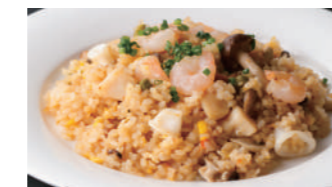
海の幸のピラフ 1,730円