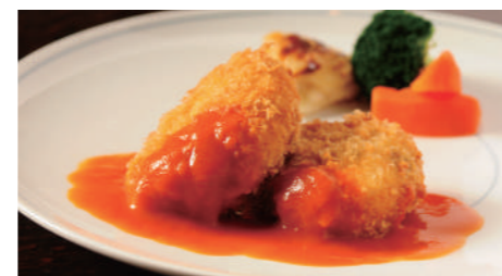
蟹クリームコロッケ (ライス または パン付) 1,830円