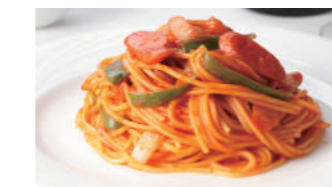
スパゲティ ナポリタン 1,620円