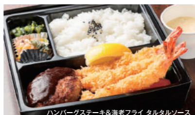
ハンバーグステーキ&海老フライ タルタルソース