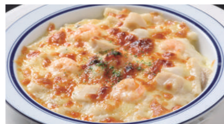
海の幸のマカロニグラタン/ドリア 1,730円