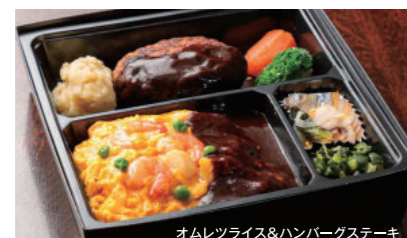
洋食ミックス弁当 2,700円 好きな洋食2種・季節の小付・香の物付 おかず物2種類の場合は、ごはんまたはパンが付きます。 容器の関係上、ご飯もの同士の組み合わせはできません。予めご了承ください。