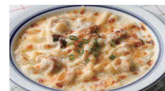
チキンと木の子マカロニグラタン/ドリア 1,940円