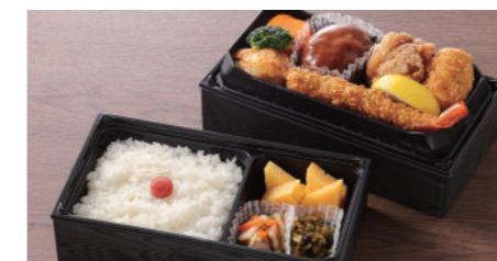
洋食弁当 1,950円 ハンバーグ・海老フライ・蟹クリームコロッケ・唐揚・一品・玉子焼・香の物・付合・白飯