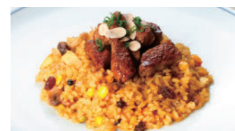
フィレビーフドライカレー 2,050円