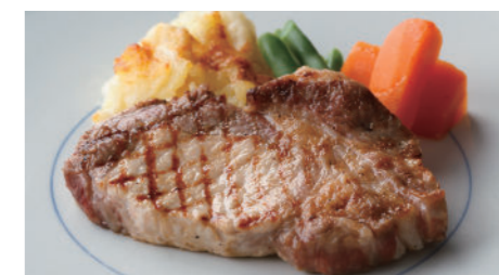
宮崎産南の島豚ロース(ソテー) 2,270円 (デミグラス または ジンジャーソース)