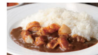
シーフードカレー 2,270円