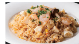
海の幸のピラフ 1,940円