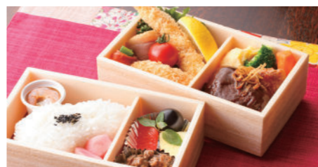
洋食詰合せ二段弁当 3,240円 ハンバーグステーキ・海老フライ・蟹クリームコロッケ・唐揚・焼魚・一品・香の物・付合・白飯・フルーツ ※写真はイメージです。内容が異なる場合がございます。