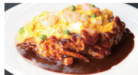
オムレツライス デミグラス 1,830円 (5~9月は衛生の観点より提供中止とさせていただきます。)