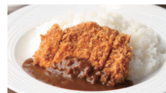
宮崎産南の島豚カツカレー 2,270円