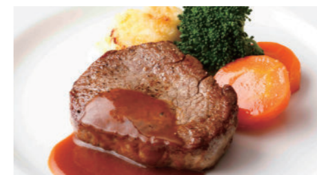
牛フィレステーキ(和風 または デミグラス) 3,890円