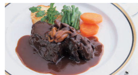
ビーフシチュー (ライス または パン付) 3,890円