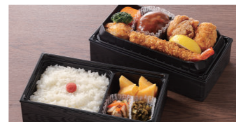
洋食弁当 1,950円 ハンバーグ・海老フライ・蟹クリームコロッケ・唐揚・一品・玉子焼・香の物・付合・白飯