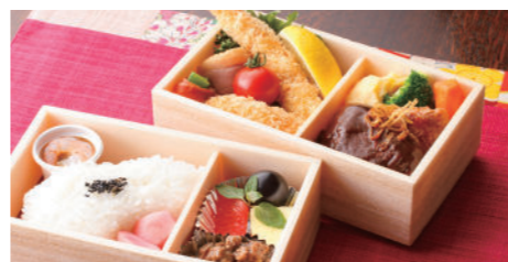
洋食詰合せ二段弁当 3,240円 ハンバーグステーキ・海老フライ・蟹クリームコロッケ・唐揚・焼魚・一品・香の物・付合・白飯・フルーツ ※写真はイメージです。内容が異なる場合がございます。